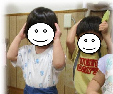
どんぐり ころちゃん

さまざまなわらべうたに 合わせて体を動かしたり 先生と一緒に歌ったりして 楽しんでいます。